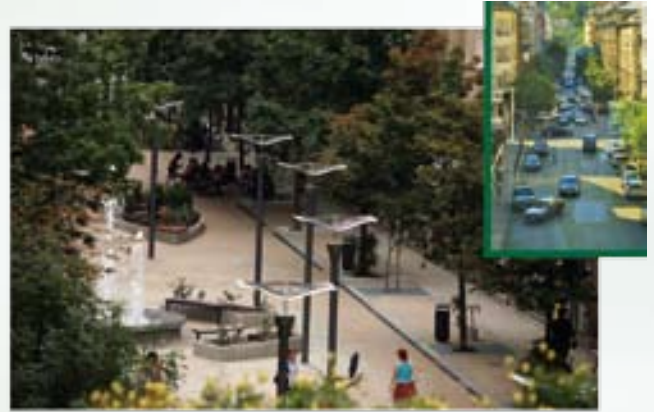
Elkészült a Lövőház utca sétálóutca szakasza