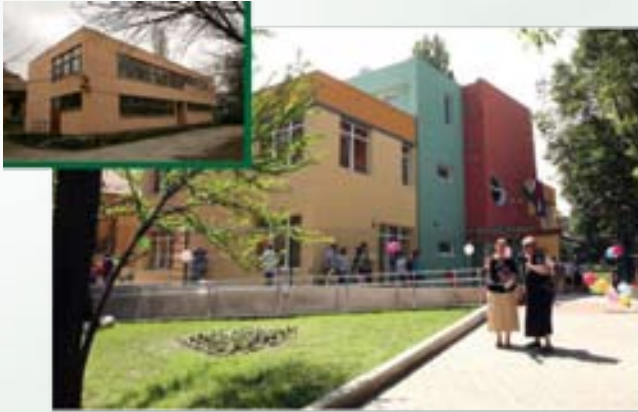
Elkészült a Hűvösvölgyi úti bölcsőde