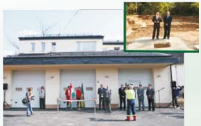
Megépült a Hidegkúti Mentőállomás