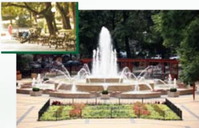
Megszépült a Mechwart liget