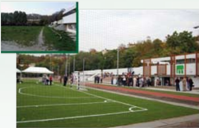
Megújult a Marczibányi sportcentrum