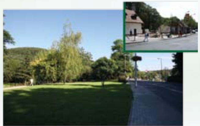
Bódéváros helyén park épült Hűvösvölgy kapujában